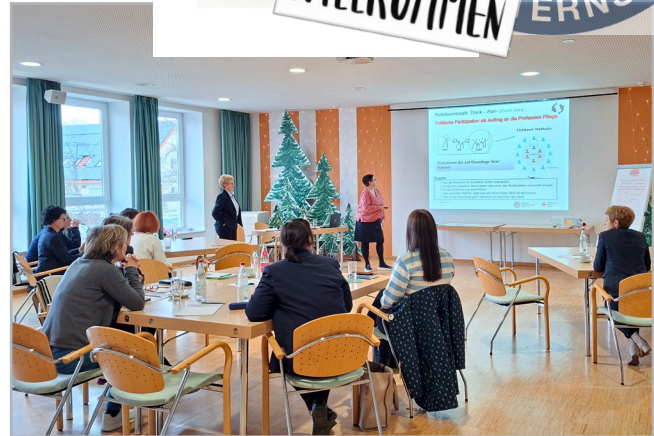
„Politikwerkstatt“ mit Mitgliedern aus der Schwesternschaft Amberg.