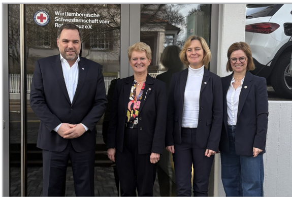
Besuch in der Württembergischen Schwesternschaft in Stuttgart.