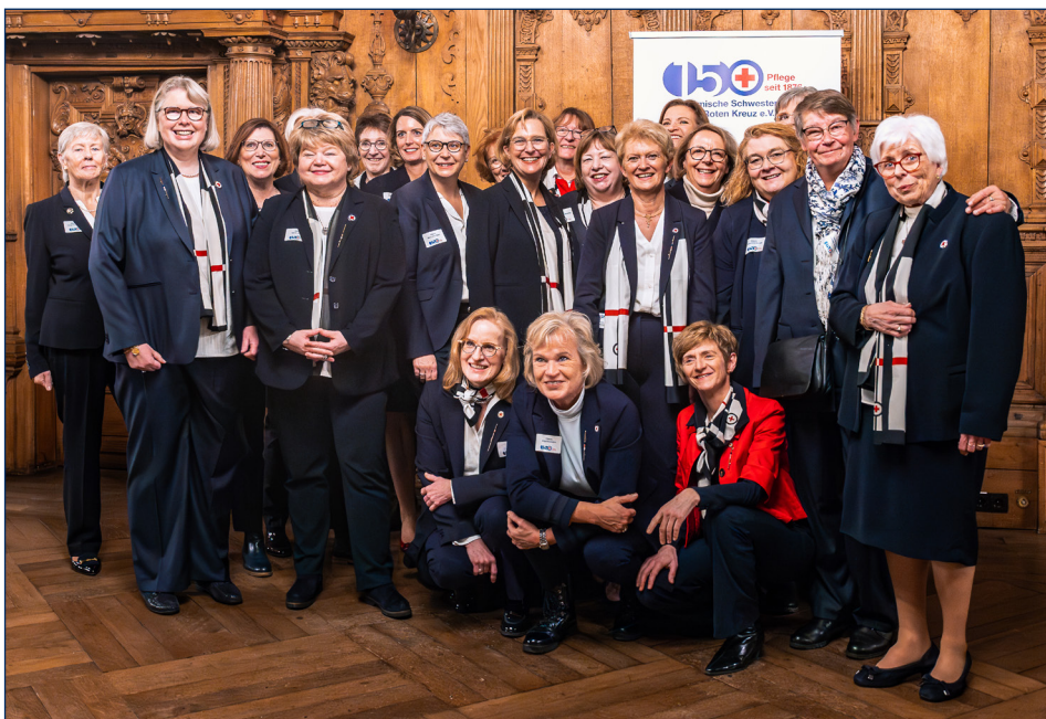
Gemeinschaft und Austausch: Insgesamt 18 Oberinnen und pensionierte Oberinnen kamen zur Jubiläumsfeier der Schwesternschaft nach Bremen.