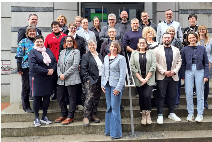
Am 21. Februar 2026 trafen sich Vertreter/innen der Landespflegeräte aller Bundesländer mit Vertreter/innen des DPR in Berlin. Ziel war die gemeinsame Beratung und Vorbereitung einer künftigen strukturierten berufspolitischen Zusammenarbeit.

ressen. Sie fungieren als zentrale fachliche Ansprechpartner der Landespolitik, von Ministerien, Verwaltungen und Öffentlichkeit in allen Fragen der Pflegeversorgung. Durch abgestimmte Positionierungen, Stellungnahmen und Beteiligung an Anhörungen etc. bringen sie pflegfachliche Expertise in Gesetzgebungs- und Reformprozesse ein und tragen so zur Professionsentwicklung, Qualitätsentwicklung und zur Sichtbarkeit der Pflegeberufe bei. Die DRK-Schwesternschaften sind als Mitglieder in den jeweiligen Landespflegeräten Teil dieser pflegeberuflichen Organisationsstruktur in den Regionen.