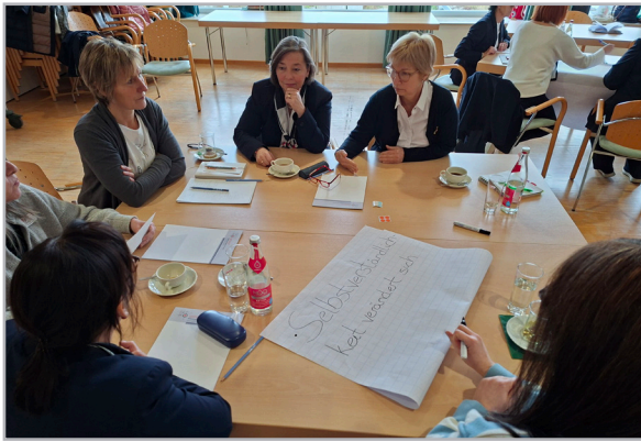
Gemeinsames Arbeiten in Kleingruppen.